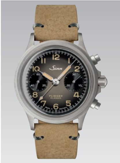
356 FLIEGER Klassik AS E: sandfarbendes Nubuk-Wildschweinlederarmband. Garantie 2 Jahre. ø 38,5 mm (Abb.: 1:1)