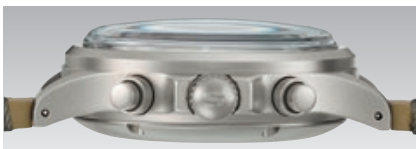
Rückansicht und Seitenansicht. (Abb.: 1:1)